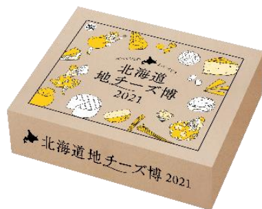
(おすすめセットBOX イメージ)

また、カッティングボードやグラス等、チーズの時間がもっと楽しくなる 地チーズ博オリジナルグッズを販売いたします。