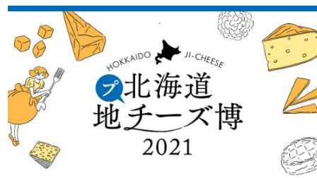
(プチーズ博 ビジュアル)

北海道地チーズの日替わり食べ比べセットの提供や、 3個以上地チーズを購入いただいた方へオリジナルエコバックを プレゼントするキャンペーンを実施いたします。